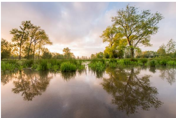
f/13, 1/5, ISO 200, 14mm op full frame, 0.6 harde grijsverloopfilter

De Keuzemeersen wordt doorspekt met kleine grachtjes die je kan gebruiken om je foto diepte te geven en de kijker mee te nemen in het beeld. Bovendien maak je bij windstil weer kans op prachtige reflecties of een laagje nevel boven het water. Die ochtendnevel is ongetwijfeld het mooist wanneer je in tegenlicht fotografeert. Hier kan je tijdens de voorbereiding extra aandacht aan besteden door op zoek te gaan naar leuke hoekjes die oostelijk georiënteerd zijn. Om het enorme contrast bij tegenlicht op een goede manier te fotograferen zal je grijsverloopfilters nodig hebben. Aangezien het dynamische bereik van de camera's tegenwoordig steeds beter wordt, kom je met een 0.6 of 2 stops grijsverloopfilter wellicht al een hele eind. Let wel op wanneer je grijsverloopfilters gebruikt en ook reflecties fotografeert. Je moet er namelijk voor zorgen dat de reflectie niet te licht wordt, want dan oogt de foto erg onnatuurlijk en verraadt dit ook meteen het (onjuist) gebruik van filters. Naast reflecties in de grachten en beekjes kan ook de vegetatie erin of erlangs de perfecte voorgrond vormen. In de lente is deze bovendien mooi groen gekleurd, zodat de foto fris en levendig lijkt. Met een polarisatiefilter kan je deze groene tinten bovendien nog wat extra in de verf zetten.